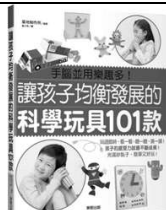
《讓孩子均衡發展的科學玩具 101 款》 (中文書)

《The Ultimate Book of Space》的互動方式多種：立體的地球、可以動手發射的火箭、滑一滑可以戴上的頭盔、太空站綁線的太空人（小朋友可以拿著，讓太空人飄浮移動）、螺旋蚊香拉開看銀河，還有堅固的「關節」零件，機器人手臂可以靈活移動！超過 40 多個翻翻拉拉互動的設計。此外，少不了知識大進補：火箭的超級比一比、太空人裝備、太陽系等。同學們在閱讀本書後，將會製作銀河星球模型。