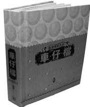
《車仔檔》(中文立體書)

跟著多奇、小空、小天，一起來體驗地上、地下和海底 100 層樓的驚奇吧！每一層樓都住著不同的主人，每一層樓都有不同的小故事，住在第 100 層樓的主人到底是誰呢？同學們更可以在閱讀本書後，一起設計 100 層樓的家。