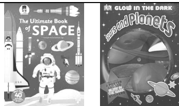
《The Ultimate Book of SPACE》 《STAR AND PLANETS》 (英文立體書)

《樹懶的森林》：在美麗的森林裡，樹懶過著自由快樂的日子。牠並不知道這片森林即將面臨著消失的命運。機器怪手大口大口的吃掉樹木，直到最後一棵樹木倒下，樹懶才意識到，自己美麗的家園消失了！樹懶的森林還會回來嗎？《出發吧，海洋號！》：海洋號準備出發，到世界的各大海洋探險了。不過，為什麼水面上看起來熱鬧的港口，海底下卻髒亂一片呢？這是海洋號給我的一課！閱讀本書後，同學們會一同創作一張立體卡。