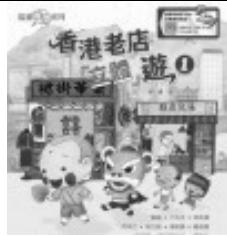
《香港老店「立體」遊》(中文書)

本書收錄了 101 款專為孩子設計的玩具，每項玩具的製作過程或玩樂方式，都包含科學的元素。從利用空氣發射的火箭、利用水壓打造的小噴泉、利用作用力來玩的不倒翁，到利用彈力的小汽車、利用磁力連結的電車……在玩樂的過程中，自然而然發現生活中的科學原理！在閱讀本書後，同學們一起動手做科學實驗。