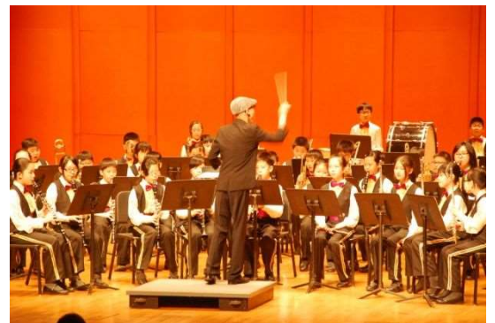
樂團成員代表學校參加比賽

本年度管樂團將會招收 30 名新成員，有興趣加入管樂團的 P.2 至 P.6 同學及舊成員，可在通告上剔選「管樂團」一欄。