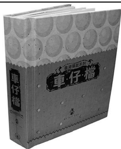
《車仔檔》(中文立體書)

本書深入淺出地介紹了許多大發明,最適合天馬行空的小朋友閱讀。小朋友能從故事中,了解到只要用心觀察,大膽假設,努力求證,也可以成為未來的科學家!同學們在閱讀本書後,製作太陽能車、機械人、機械狗等科學製作。