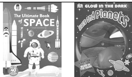
《The Ultimate Book of SPACE》、《STAR AND PLANETS》及《SPACE》 (英文立體書)

你一定想參加這個最豪華的度假行程!搭乘水晶遊園車暢遊陀螺谷,欣賞絕對震撼的滄龍餵食秀,見識讓恐龍復活的最尖端生物科技!快進入侏羅紀世界園區,體驗不可思議的恐龍世界!(本書以圖書館的 IPAD 一同閱讀其中的立體果效,大家不要錯過哦!)