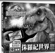
《侏羅紀世界: 3D 擴增實境 APP 互動恐龍電影書》(中文書)

小朋友!當你望著維多利亞港兩岸的高樓大廈時,有沒有想像過一百多年前的香港是什麼模樣的呢?現在請你跟隨著書的足跡,看看香港怎樣由一個落後的小漁村,逐漸發展變化為繁華熱鬧的國際大都會。這是第一本以維港兩岸海岸線的變化來反映香港歷史變遷的繪本。(本書以圖書館的 IPAD 一同閱讀其中的立體果效,大家不要錯過哦!)