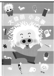
《科學遊樂場》(中文書)

☆ A 組讀書會 ☆ 適合三至四年級同學 (逢星期四: 9/1、16/1 合共兩天)